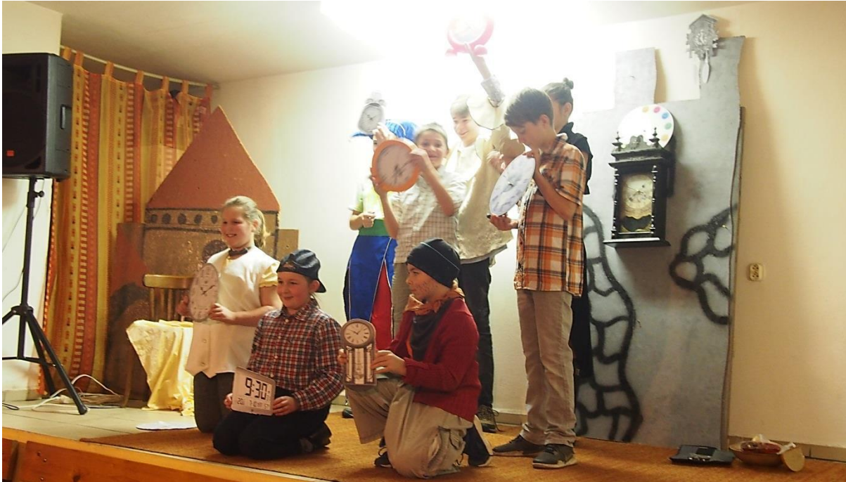
Vystoupení mladých hasičů - pohádka O hodináři Pěrkovi